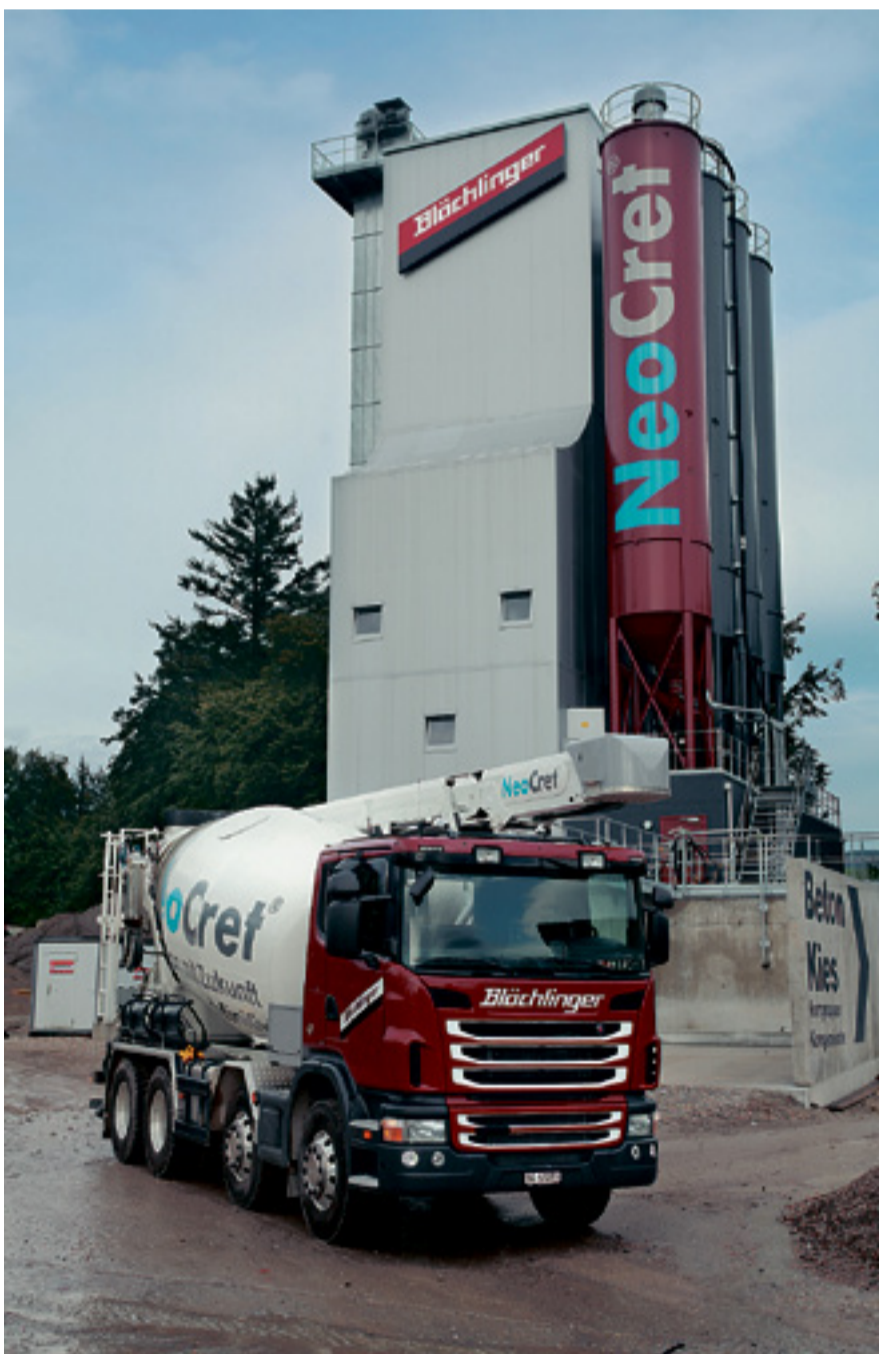
Das neue Betonwerk der Blöchlinger AG überragt alle Anlagen. Im Vordergrund einer der modernen Fahrmischer-Lastwagen, welche die Baustellen mit NeoCret versorgen.

2012/13 stehen Planung und Bau eines zweiten Kieswerks zur Vergrösserung der Produktionskapazität und des Produktsortiments auf dem Investitionsprogramm. Die Blöchlinger AG strebt unter der verjüngten Führung ein nachhaltiges Wachstum an, erläutert Cornel Blöchlinger; allfällige Zukäufe würden bei Bedarf geprüft. Ein besonderes Augenmerk lege man wie bisher auf das nahtlose Schliessen von Arbeitsprozessen und Wertschöpfungsketten – vom Rohstoff bis zum fertigen Produkt. Die Positionierung als kompetenter Anbieter in den Bereichen Aufbereitung, Entsorgung und Versorgung soll beibehalten und weiter entwickelt werden. Das frühzeitige Erkennen von Marktlücken- und -bedürfnissen zählen die Brüder Blöchlinger ebenso zu ihrer zukünftigen Strategie. (e)